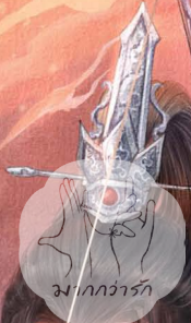
ม. ท้าวอาร์ค