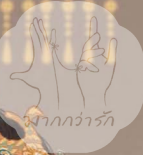
มากกว่ารัก