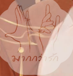
มากกว่ารัก