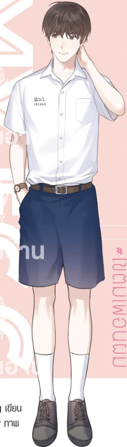
Kinsang เขียบ kanapy กาว